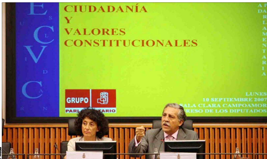
La ministra Cabrera participó este lunes en una jornada parlamentaria sobre Educación para la Ciudadanía

Por su parte, el Gobierno central que preside José Luis Rodríguez Zapatero anunció este lunes una ambiciosa medida sociosanitaria: los niños y niñas de entre 7 y 15 años podrán visitar gratis al dentista para la realización de una revisión anual, gracias al nuevo Plan de salud bucodental para todo el Sistema Nacional de Salud (SNS) que pretende impulsar