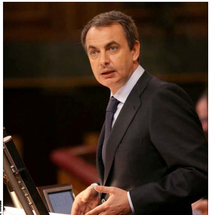
Zapatero, durante su intervención en el pleno extraordinario

Rajoy deja claro que prefiere el uso partidista de la violencia al acuerdo en un tema de Estado