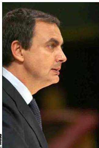
Zapatero, en el pleno

oportunidad cierta que se desprendía de la declaración del alto el fuego tras tres años sin víctimas mortales”.