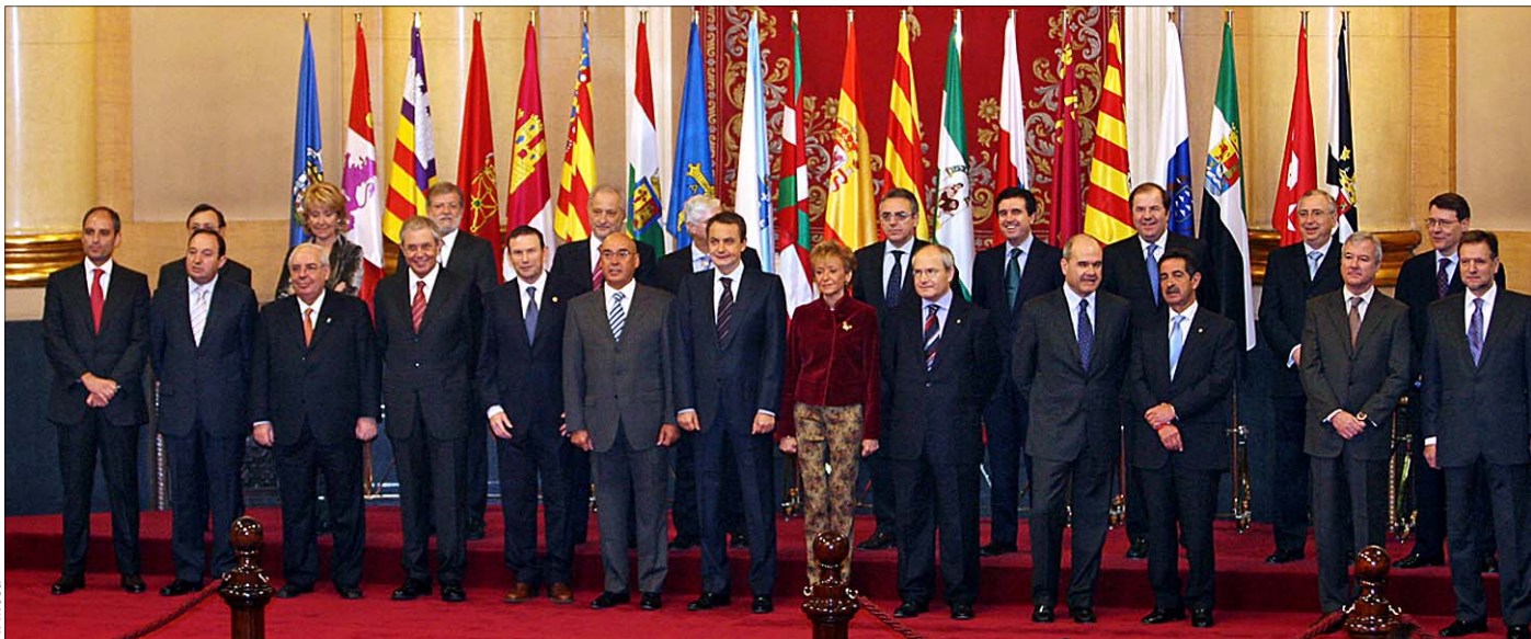
Foto de familia de la III Conferencia de Presidentes Autonómicos, celebrada el pasado jueves en las dependencias del Palacio del Senado