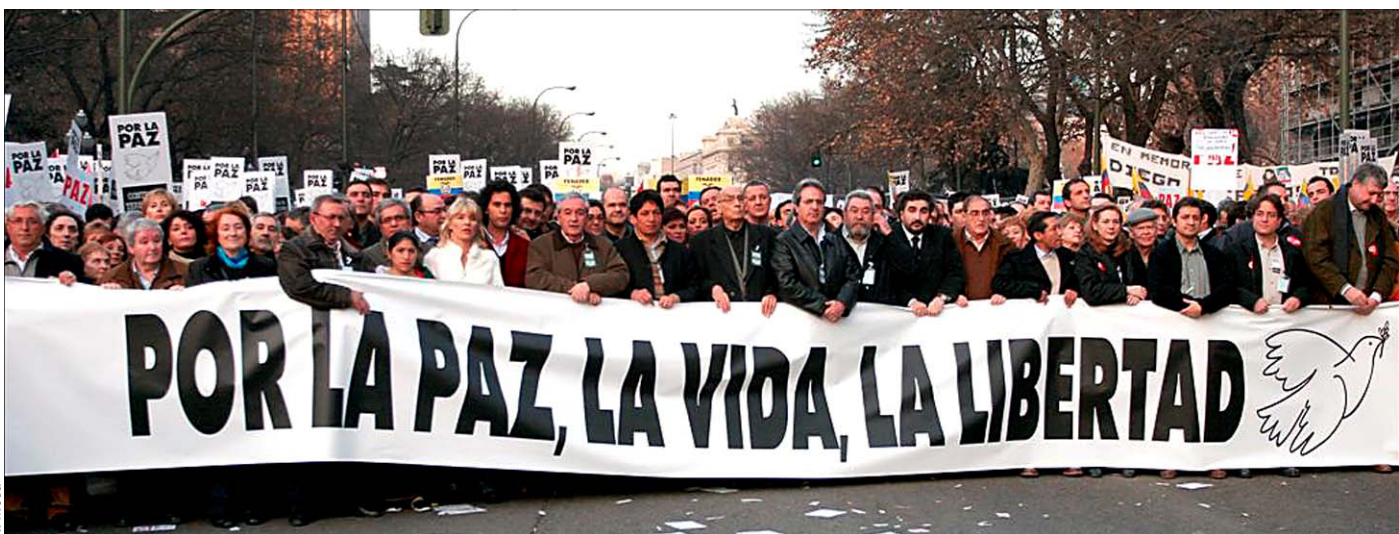
Pancarta de la cabecera de la manifestación que recorrió las calles de Madrid el pasado sábado y que reunió a centenares de miles de personas

El PSOE reclamó al PP, en vano, que se incorporara a la unidad