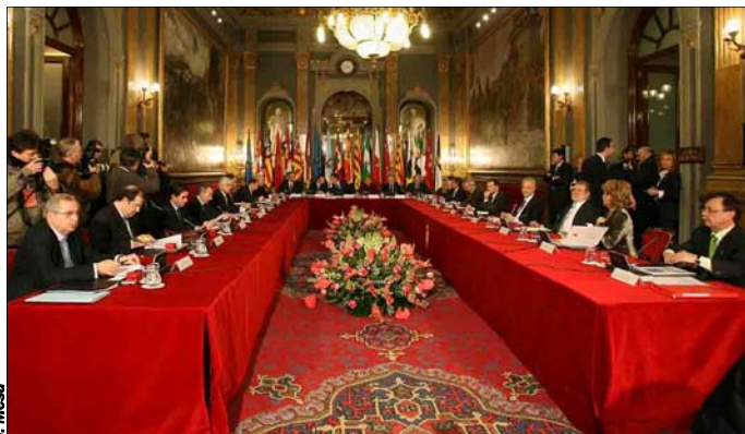
¿Quién fue el imrepresentable presidente del PP que grabó a Zapatero?

Por su parte, el Secretario General del PP, Ángel Acebes, se pregunta por qué tuvo que ser "uno del PP" quien realizara la grabación. La respuesta es sencilla, señor Acebes: sólo alguien de su partido es capaz de protagonizar una actuación tan vergonzosa.