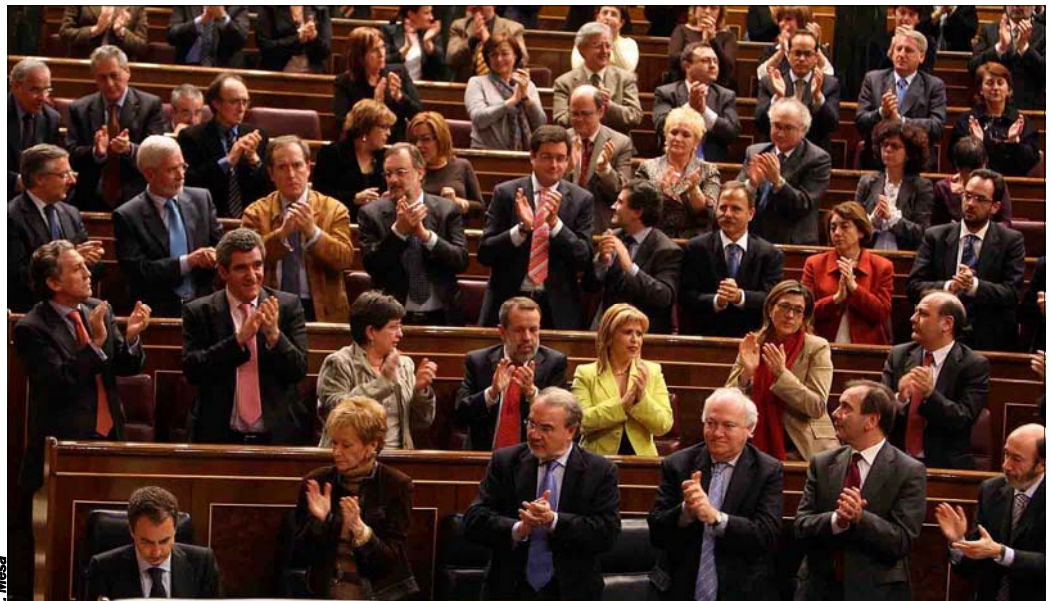
Los diputados socialistas aplauden la intervención de Zapatero al finalizar su discurso en el Congreso

Zapatero insistió en que pretendía “reconstituir y fortalecer” la unidad antiterrorista, y dijo que, en el proceso de paz, actuó como deseaba la mayoría de españoles, tratando de aprovechar “una