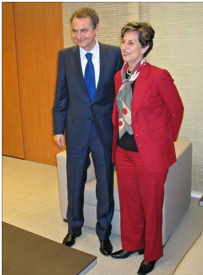
Zapatero e Isabel Allende, durante su encuentro en Ferraz

Tras la reunión de la Ejecutiva, Blanco envió, en nombre de los socialistas españoles, un mensaje fraternal "de cariño y de solidaridad al pueblo de Chile y a su democracia recuperada". Asimismo, calificó de "sorprendente" que quienes, cuando estaban en el Gobierno, "no pusieron nada de su parte" para que el dictador fuera juzgado en España, "se presenten ahora como los defensores de la justicia y de la libertad en Chile". Igualmente manifestó su sorpresa ante el hecho de que "esos