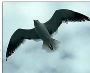
La gaviota del PP, desorientada

actitud, el PP "corre el riesgo de parecer un partido desagradable". "En la raíz de los problemas del PP está su incapacidad de sacudirse el trauma de su pérdida de poder", agrega, explicando cómo los altos cargos del PP "han avivado teorías conspiratorias que todavía intentan establecer algunas relaciones entre los islamistas y ETA" en los atentados del 11 de marzo en Madrid, a pesar de que "fiscales y policías están ahora convencidos de que sólo musulmanes radicales"