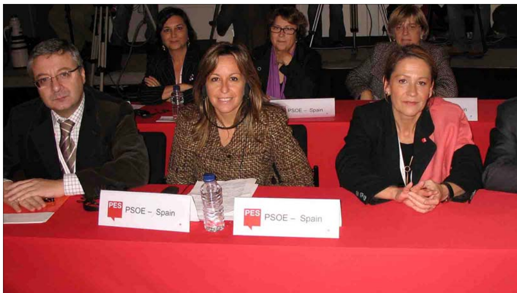
Aspecto de la delegación socialista española que viajó al Congreso del PES celebrado en la ciudad de Oporto

políticas comunes para impulsar la construcción europea desde el punto de vista político, social y económico”, valoró el dirigente del PSOE. Blanco matizó que los socialistas españoles siempre han apostado por Europa, y que lo propuesto por el PES coincide con la visión del PSOE