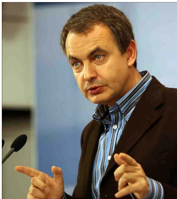
Rodríguez Zapatero, durante su intervención en el Comité Federal

El presidente ironizó sobre que entiende que entiende ese vídeo "como un esfuerzo con retraso, pero como un esfuerzo de autocrítica con 3 años de retraso", aunque "nos hubiera gustado que la autocrítica hubiera empezado con Irak, pero bueno, des-