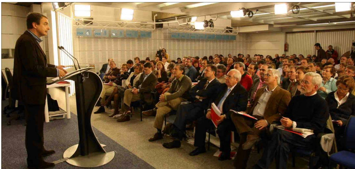
José Luis Rodríguez Zapatero desgranó ante el Comité Federal celebrado el sábado en la sede de Ferraz los logros económicos de su Gobierno