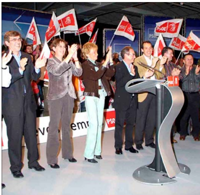
La vicepresidenta, Antich y otros candidatos, en uno de los mítines

De la Vega se refirió a la reforma del Estatut de Baleares para asegurar que verá la luz "en unos meses", una reforma, dijo, que "gracias al esfuerzo de todos, a nuestra capacidad de diálogo y de buscar el acuerdo, va a permitir que los mallorquines tengan más derechos, que la Administración balear tenga más recursos y competencias y que haya más protec-