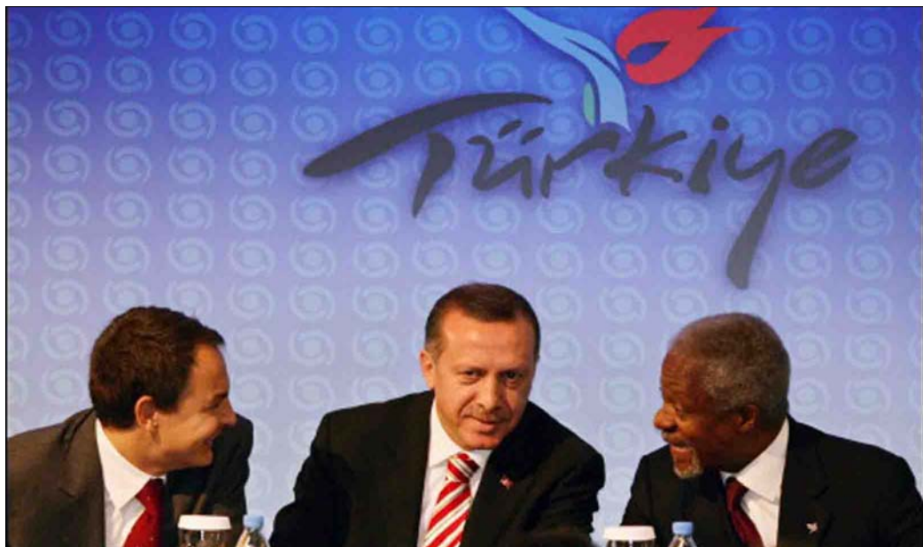
José Luis Rodríguez Zapatero, Erdogan y Annan, en la rueda de prensa que ofrecieron en Estambul

Kofi Annan también reiteró su compromiso con la iniciativa. Sobre las referencias del informe del GAN a las inter-