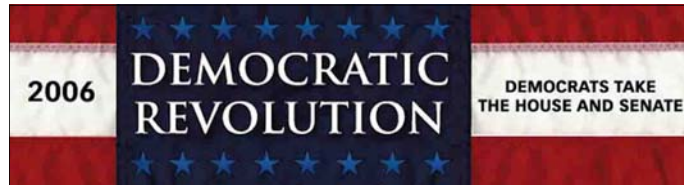
Banner de la victoria demócrata ( www.democrats.org )

Sin palabras. Vivan la moderación, el centrismo y la mesura de la que hacen gala, día sí y día también, los dirigentes del PP. ¿Y Aznar en el 98, qué, también hacía suyos los argumentos “de los señores de las pistolas” cuando abrió contactos “con el Movimiento de Liberación Nacional Vasco”?