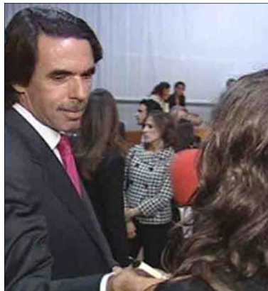
Aznar y Marta Nebot

La SER informaba esta semana de que el ático que el ex presidente del Gobierno José María Aznar y su mujer Ana Botella compraron hace un año en la costa marbellí figura en la lista de construcciones ilegales elaborada por la actual gestora del Ayuntamiento, debido a “mayor edificabilidad de la permitida”. Los 260 metros cuadrados con dos plazas de garaje y trastero están en una urbanización que se encuentra en la primera página del listado de licencias otorgadas y no ajustadas al Plan General de Ordenación Urbana de 1986, además de figurar también en el mapa de la web del Ayuntamiento de Marbella bajo el epígrafe “licencias no ajustadas al planeamiento”. El ex