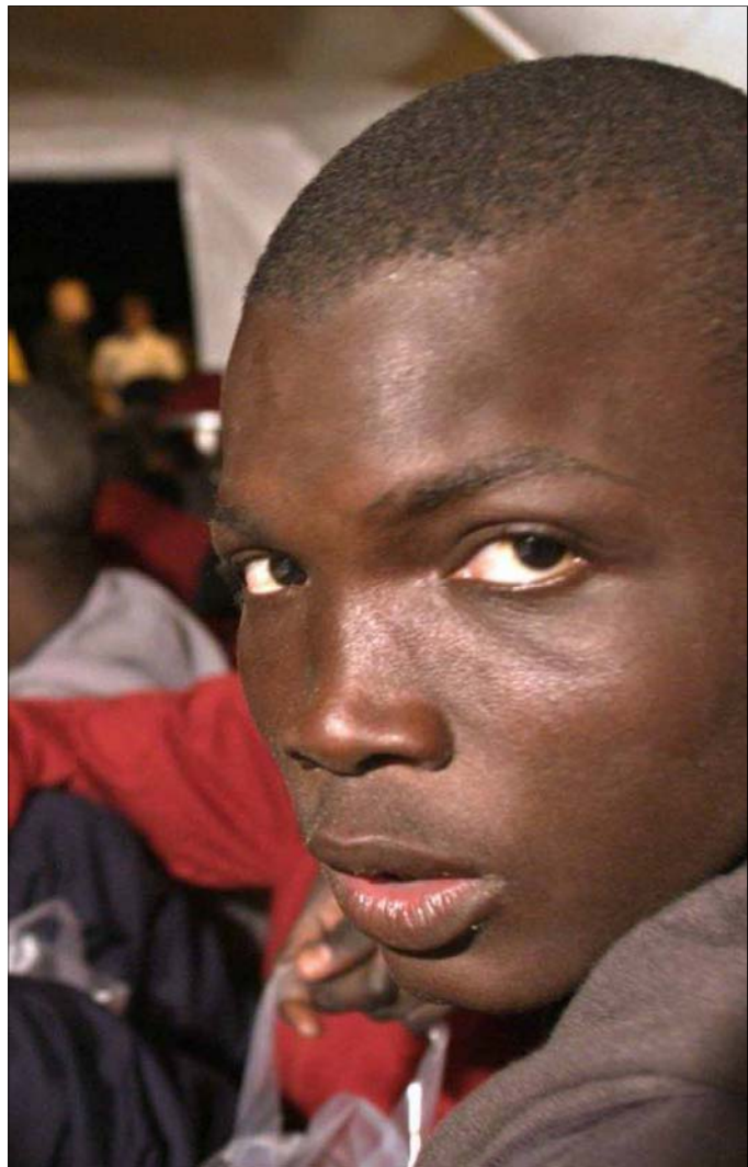
El Gobierno no renuncia a lograr un pacto de Estado en esta materia

De la Vega destaca el deseo del Gobierno y de los grupos para consensuar medidas contra la Inmigración ilegal sin renunciar a alcanzar un Pacto de Estado