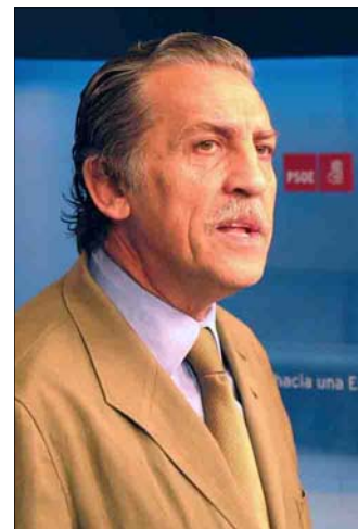
Diego López Garrido

El portavoz del Grupo Parlamentario Socialista, Diego López Garrido, criticó "la posición destructiva del PP" ante el Pacto de Estado sobre inmigración ofertado por la vicepresidenta De la Vega a los grupos parlamentarios. Para el portavoz socialista, que el PP reste credibilidad a la propuesta del gobierno es "un pretexto más para no colaborar nunca con el Ejecutivo en la mejora del bienestar de los ciudadanos", e invitó al PP a sumarse al resto de grupos y trabajar en una subcomisión "donde podrán presentar sus propuestas para desarrollar una política común y consensuada en materia de inmigración". López Garrido aprove-