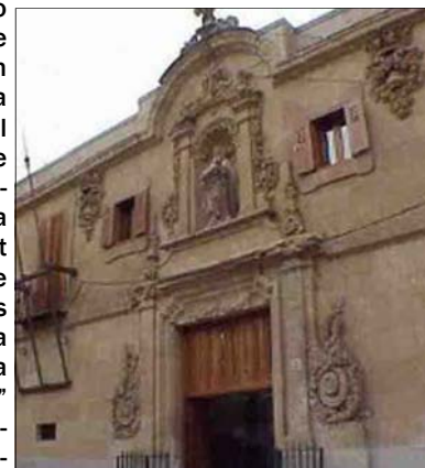
Sede del Archivo de Salamanca

A su juicio, el PP "intentó retorcer el ordenamiento jurídico" al presentar ese