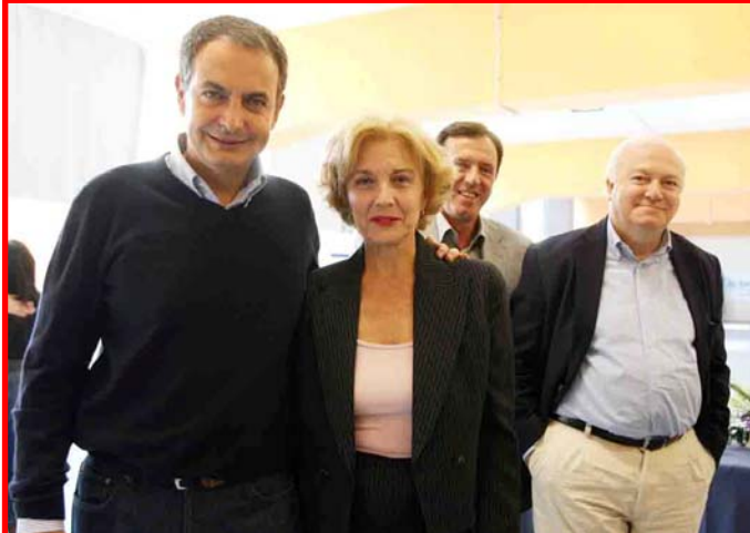
La actriz Marisa Paredes actuó como presentadora del mitin valenciano. La afamada intérprete, que se definió como una persona "de izquierdas", subrayó que ya es hora de que la izquierda sustituya en el poder autonómico al PP.