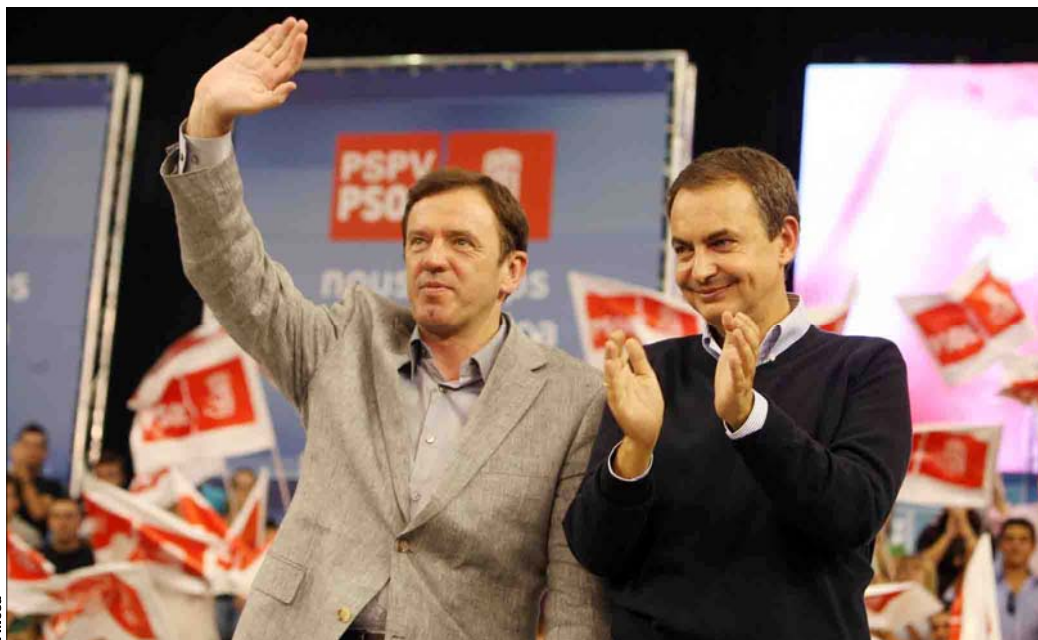
José Luis Rodríguez Zapatero y Pla, en el mitin que el PSOE ofreció en Valencia ante unas diez mil personas

Rodríguez Zapatero defendió esta postura en el acto público celebrado en Valen-