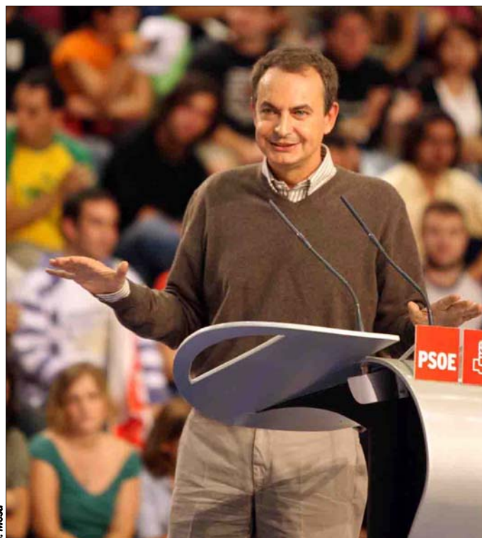
Rodríguez Zapatero, durante su intervención en el mitin de Alorcón

Al respecto, el presidente del Gobierno anunció la convocatoria, antes de fin de año, de un concurso internacional para la construcción