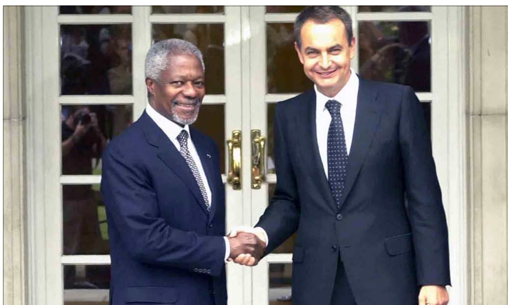
El secretario general de la ONU, Kofi Annan, agradeció en La Moncloa a Zapatero el apoyo de España

El objetivo de la misión de los soldados españoles es convertir el alto el fuego entre Líbano e Israel en una “paz duradera que dé seguridad a la región”. Así lo expre-