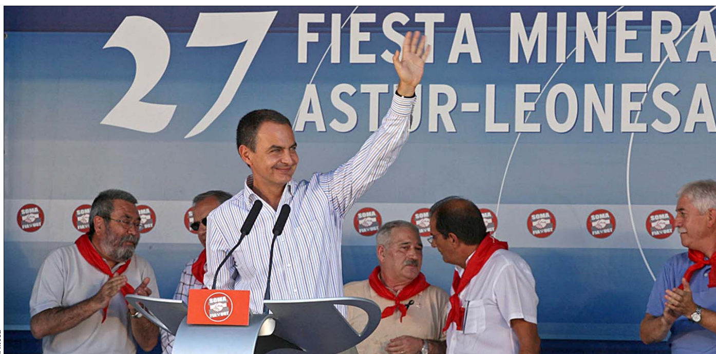
José Luis Rodríguez Zapatero fue fiel a su costumbre de elegir las campas de Rodiezmo, entre Asturias y León, para abrir el nuevo curso político