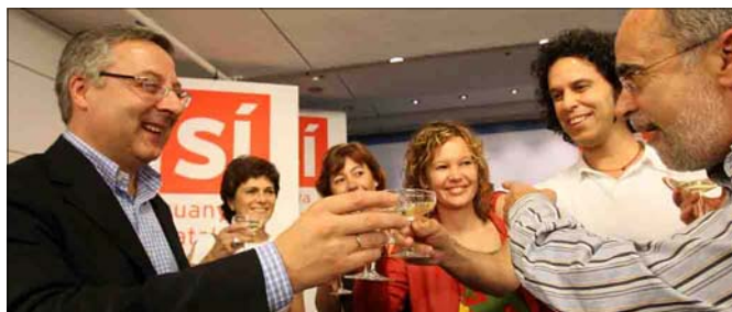
Celebración en Ferraz de los resultados del Estatuto de Cataluña

y sus errores son también colosales". De hecho, el líder del PP "derrapó, desbarró y se salió de la vía democrática", cuando no "ofendió" a