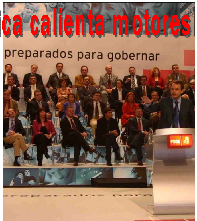
Rodríguez Zapatero, en la Conferencia Política de 2004

La Comisión Ejecutiva Federal se ha reservado 200 puestos más para invitados. El secretario de Organización del partido, José Blanco, ya ha adelantado la participación de personas "de relieve internacional".