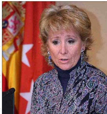
Envíen su CV a Esperanza Aguirre...

no de Aznar. Además, Aguirre –que también ha colocado a otras destacadas políticas, como Gotzone Mora o Cristina Alberdi– ha ido más allá en su afán por colorar a los seguidores de Aznar. La presidenta no sólo ha fichado a ex altos cargos. También ha incorporado a diversos puestos a diputados, e incluso, a antiguos responsables de gobiernos autonómicos. Así,