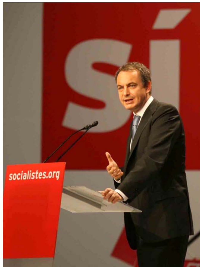
Rodríguez Zapatero, en el mitin de cierre de la campaña por el 'sí'

Con este nuevo Estatuto, ganan Cataluña y España. Cataluña, porque a partir de ahora tiene un nuevo y más eficaz instrumento legal para