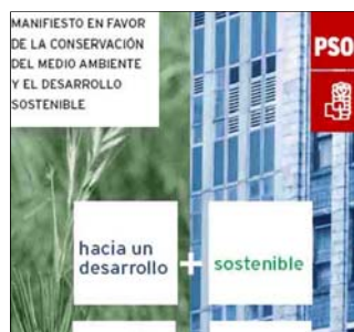
Portada del manifiesto

El PSOE difundió este lunes, con motivo del Día Internacional del Medio Ambiente, un manifiesto en el que insta a comunidades autónomas y ayuntamientos a asumir un conjunto de trece medidas que tienen por objeto luchar contra el cambio climático en nuestro país.