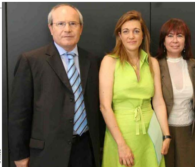
Soraya Rodríguez, flanqueada por Narbona y Montilla, en Ferraz

Entre las medidas propuestas a sus comunidades y municipios destacan las de elaborar planes específicos de lucha contra el cambio climático, procurar el ahorro y la eficiencia energética en sus ámbitos de gestión (como el alumbrado público), aprobar ordenanzas para instalar energía solar en todos los edificios públicos o impulsar los equipamientos domésticos eficientes.