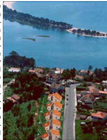
Vista de Nigrán

Una vez, las sombras de la corrupción y de la especulación urbanística planean sobre este asunto y fueron el detonante que llevó a más 40 vecinos del pueblo a irrumpir en el Pleno del Ayuntamiento en el que iba a aprobarse un