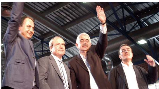
Rodríguez Zapatero, José Montilla y Pasqual Maragall, al finalizar el mitin

contra de aquel texto pero esa imagen es todo un símbolo de lo que es la derecha, que dice no cada vez que la mayoría impulsa un cambio, aunque luego lo aceptan, pero siempre con veintitantos años de retraso; nunca están en el momento".