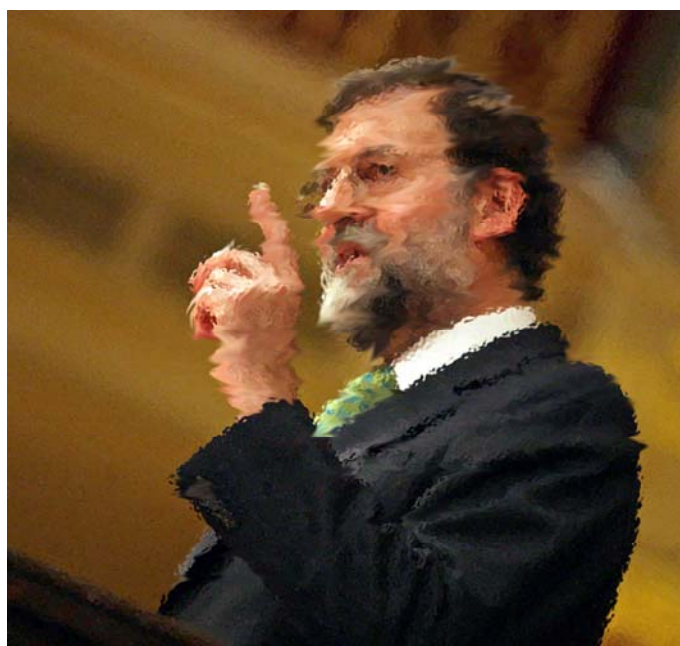
La falta de alternativas desdibuja a Mariano Rajoy ante la ciudadanía

El líder del PP vuelve a perder el debate frente a un sólido Zapatero