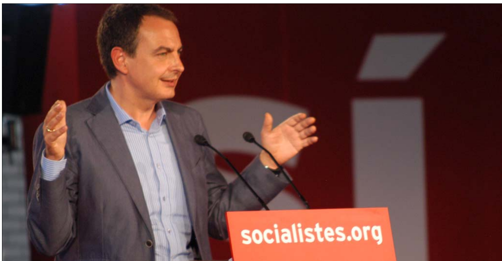
José Luis Rodríguez Zapatero protagonizó en Lleida su primer mitin en la campaña del Estatut

Ante casi 2.000 personas, Zapatero aseguró que el 18 de junio brindará "con cava catalán" por la victoria del sí en el referéndum. Para el presidente del Gobierno, lo mejor del texto es que supone "un avance para España", ahondando en "una Cataluña amplia y grande, donde caben todos". En este sentido, destacó la "nueva relación entre los gobiernos" central y de Cataluña, fruto del nuevo Estatut y alejada "del temor y