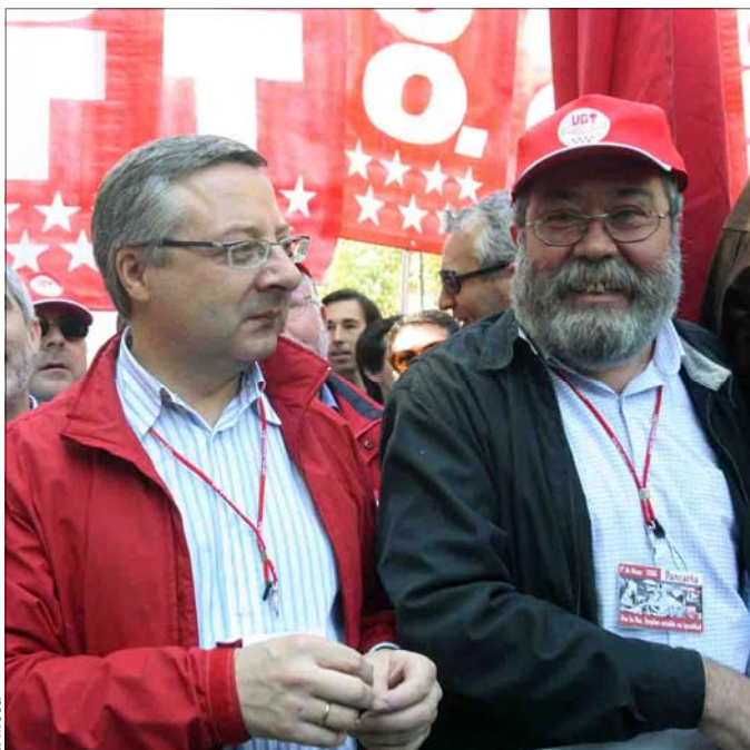
José Blanco encabezó la delegación socialista en la marcha de Madrid

también la Ley de Igualdad, una ley que persigue la plena incorporación de las mujeres al mundo laboral en igualdad de condiciones.