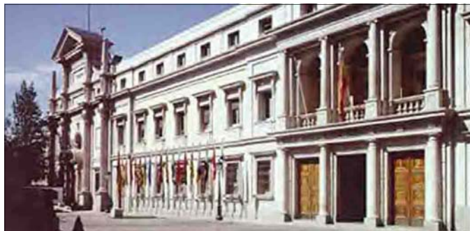
Imagen del Palacio del Senado

regionales del PP, con sus argumentos apocalípticos sobre el futuro de España, sino que tam-