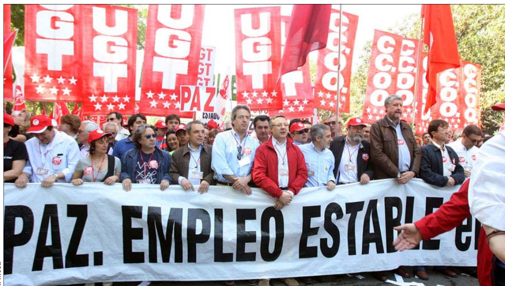
Aspecto de la pancarta que encabezó la manifestación del Primero de Mayo celebrada en la capital española