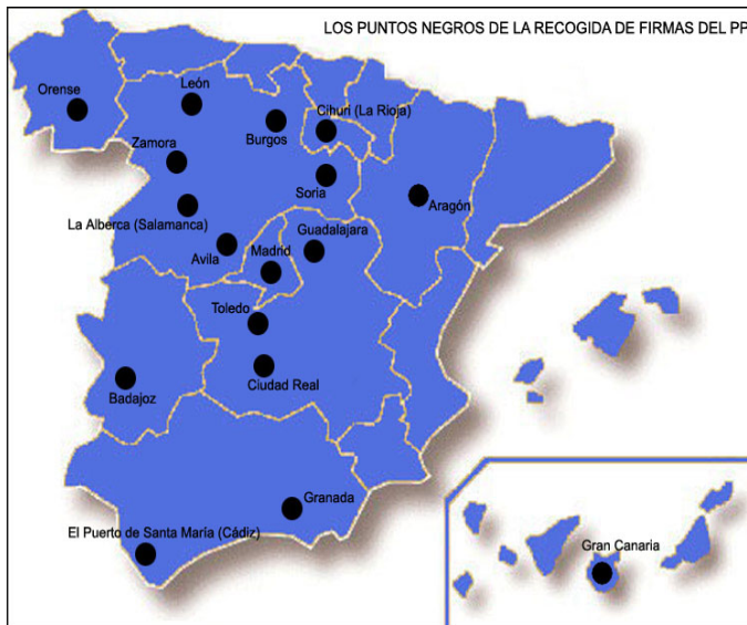
El PP extiende por toda España métodos poco claros para recoger firmas

En algunos casos, como ha sucedido en un colegio de El Puerto de Santa María (Cádiz), fue el propio profesor quien repartió entre sus alumnos el documento utilizado en la campaña del PP para que se lo entregaran a sus padres. En Granada, una profesora del colegio Ave María Casa Madre fue acusada por padres de alumnos de recabar firmas entre sus hijos. Pero esta no es la única situación esperpéntica