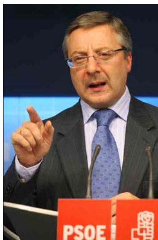
Blanco recordó que el 23 de abril tendrá lugar el mitin de Vista Alegre

próximas citas electorales. Dentro de la apretada agenda del PSOE para los próximos meses se inscribe una campaña para explicar los dos primeros años de la legislatura de Rodríguez Zapatero, que se abrirá el 23 de abril con un gran mitin en la madrileña plaza de Vista Alegre. El PSOE también desarrollará actos para explicar la LOE y acerca del referéndum que se celebrará en Cataluña.