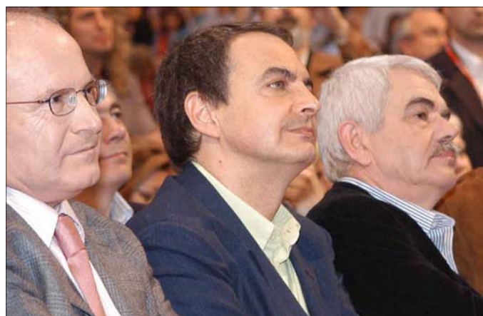
Zapatero, en un momento de su intervención en el mitin de Cornellá, en el que también hablaron dirigentes del PSC como Maragall y Montilla