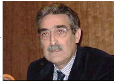
José Manuel Medina, alcalde de Orihuela