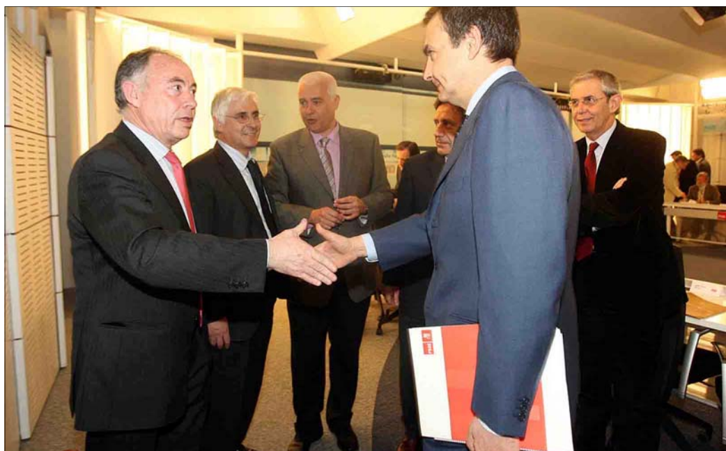
Rodríguez Zapatero saluda al presidente de la FEMP en presencia de varios dirigentes territoriales