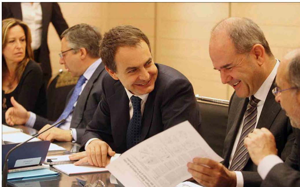
Imagen de la última reunión mantenida por la dirección federal del PSOE en la sede de Ferraz

Sobre el caso concreto de Marbella, Blanco ha recordado que en los años 2001 y 2003 toda la oposición en el Ayuntamiento marbellí pidió